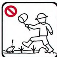
田や畔に入らない