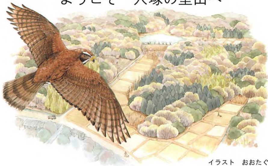
イラスト おおたぐろ まり

穴塚大池の周辺の里山は、関東平野最大級の広さを持ち、多様な生き物を育む自然の宝庫となっています。