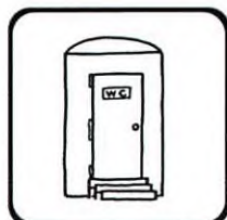
トイレはすみしましたか