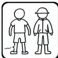
長袖長ズボン長靴