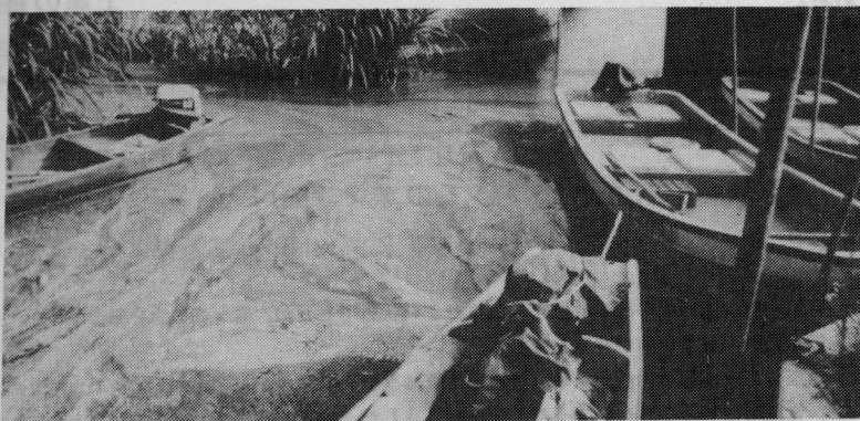
土浦市手野町 59年8月

今年の夏の猛暑の中で、アオコの腐臭に悩まされた土浦市民は、その上、飲料水の異状というダブルパンチを受けてしまった。霞ヶ浦をさかのぼって、上流10キロ地点までみどり色のペンキ状になった川の水を、市民は、みな無気味なものでも見るように、眺めていた。“この水を飲んでいるのだ!!” “いくら水道局の人が一生懸命やってくれたとしても、もとの水がペンキでは限界があるのではないだろうか” “いやそんな事はない、今はエレクトロニクスの時代だ。水を加工することなんか、わけないはずだ” そう思いながら、不安をかくせなかった。はたして8月18日頃から水道水が、変に泡立ちはじめ、お風呂に水を汲むと、まるで洗剤でもこぼしたみたいに白濁してしまっていた。“水がこんなに泡立つはずがない。お風呂の掃除の仕方が悪いのだろう” おかしい!! 家族や近所の人で話題になっても、市や県の水道部などへ問いあわせてみた人は、あまりいなかったらしい。(あとの調査で近所の人と話しあった人40%に対して、公的機関に電話したという人は、6%にすぎなかった) しかし、まさかと思う